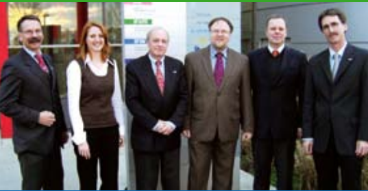
InnoRegion baut Aktivitäten 2010 weiter aus