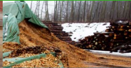
Interessante Einblicke bei Exkursion nach Homberg/Efze