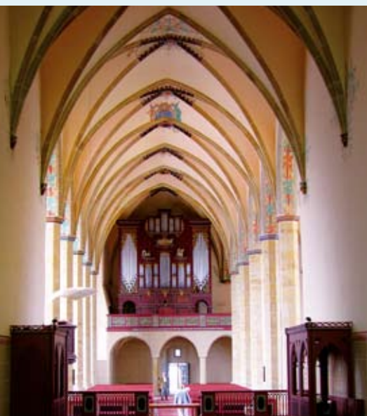
Bilder oben: Das 896 im spätgotischen Stil errichtete Kloster Möllenbeck mit Kreuzgang und Klosterkirche