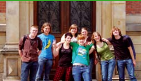
6. Hochschulorientierungswoche im Weserbergland