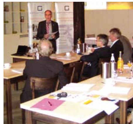
Bild: Landrat Heinz-Gerhard Schöttelndreier begrüßt die regionalen Unternehmensvertreter