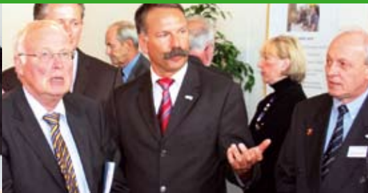
Startschuss für BioenergieRegion Weserbergland plus