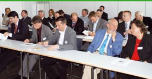
InnoRegion Weserbergland plus startet durch