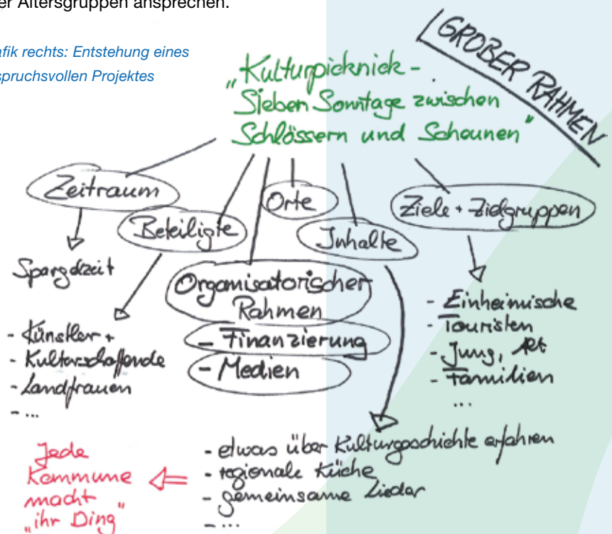
Grafik rechts: Entstehung eines anspruchsvollen Projektes