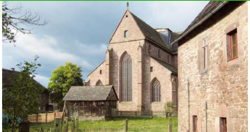
Bild Mitte: Die Klosterkirche wird häufig auch als kultureller Veranstaltungsort genutzt

~ Der VoglerRegion ist es in 2008 gelungen, für ein Großprojekt im Kloster Amelungsborn 82.000 € Leader-Mittel einzuwerben, mit deren Hilfe unter anderem Buntglasfenster und Sandsteinmaßwerke erneuert werden konnten.